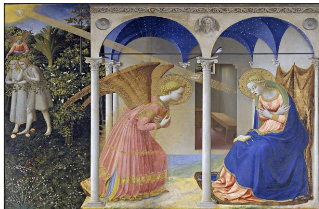
Zwiastowanie (obraz Fra Angelica)