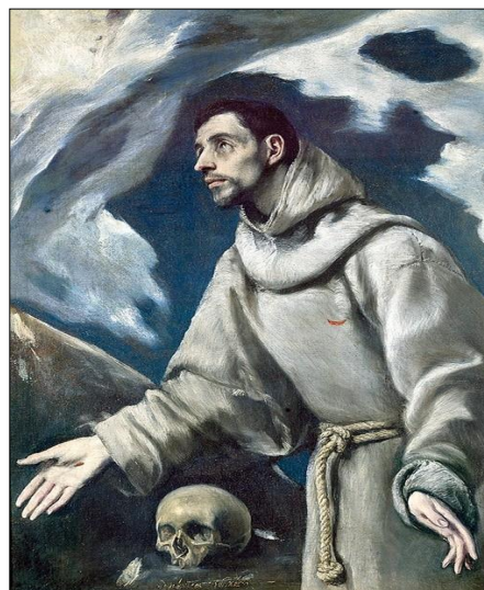
Ekstaza świętego Franciszka – Muzeum Diecezjalne w Siedlcach.