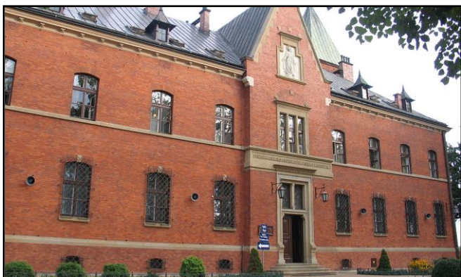
Klasztor Sióstr Miłosierdzia Bożego w Krakowie – Łagiewnikach. Dom Macierzysty.

Maria Faustyna Kowalska urodziła się 25 sierpnia 1905 r. w Głogowcu, zmarła 5 października 1938 r. w Krakowie. Święta Kościoła Katolickiego, zakonnica ze zgromadzenia Sióstr Matki Bożej Miłosierdzia, mistyczka, stygmatyczka i wizjonerka. Znana przede wszystkim jako głosicielka kultu Miłosierdzia Bożego, nazywana Apostolką Bożego Miłosierdzia oraz autorka Dzienniczka, w którym opisała swoje duchowe i mistyczne doświadczenia.